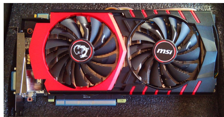
MSI GTX980 GAMING 4G videokártya :)