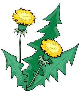
Az útszél: csupa pitypang, A bokrok: csupa fűtyhang. Tóth Árpád